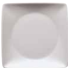
Dish flat square / Schälchen flach quadratisch / Piattino piano quadrato