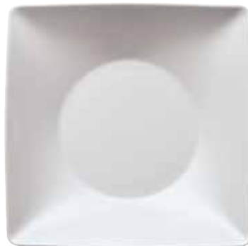
Plate deep square / Teller tief quadratisch / Piatto fondo quadrato