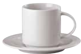
Cup / Obertasse / Tazza 0,22 ltr. / 7 3/4 oz. 67303-45