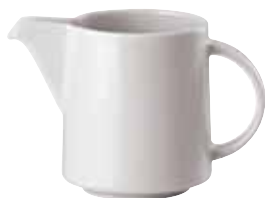
Creamer / Gießer / Lattiera 0,15 ltr. / 5 1/4 oz. 67303-58