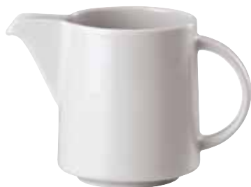
Creamer / Gießer / Lattiera 0,30 ltr. / 10 1/2 oz. 67303-59