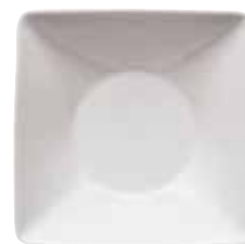
Bowl deep square / Schälchen tief quadratisch / Piattino fondo quadrato