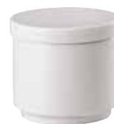
Base sugar bowl / Zuckerdosens-Unterteil / Zuccheriera senza coperchio 0,15 ltr. / 5 1/4 oz. 67303-62