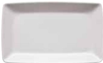
Plate flat rectangular / Platte flach rechteckig / Piatto piano rettangolare