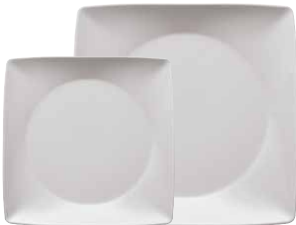
Plate flat square / Teller flach quadratisch / Piatto piano quadrato