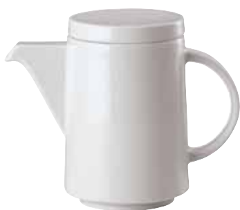
Base coffee pot / Kaffeekannen-Unterteil / Caffettiera senza coperchio 0,30 ltr. / 10 1/2 oz. 67303-49