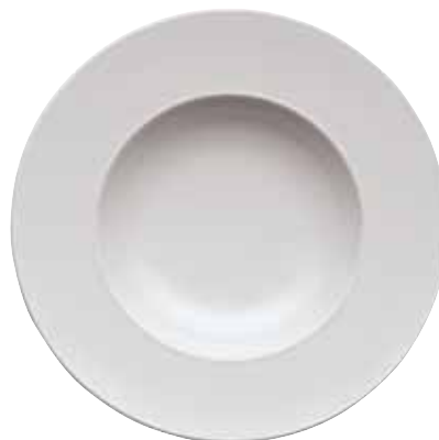
Plate flat / Teller flach / Piatto piano