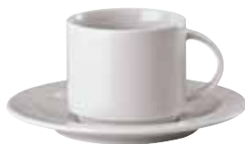
Cup / Obertasse / Tazza 0,18 ltr. / 6 1/3 oz. 67303-41