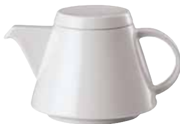
Base tea pot / Teekannen-Unterteil / Teiera senza coperchio 0,40 ltr. / 14 oz. 67303-53